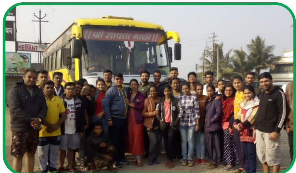
Anually Organize 2019 Motivation Academy's Trip / Tour at Goa